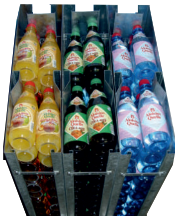
Doppelbelegung im Schacht