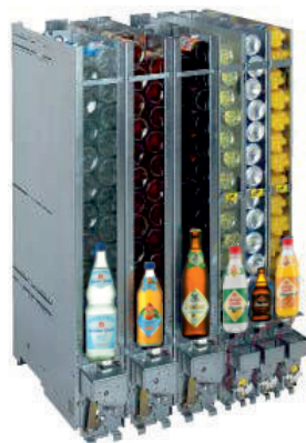
Normal- und Schmalschächte

mit Geldwechsler von 5 Cent bis 2,- € incl. Wechselgeldspeicher